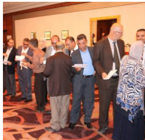
Oficiales Jordanos aprendiendo técnicas de comunicación durante el Programa de Capacitación en Liderazgo