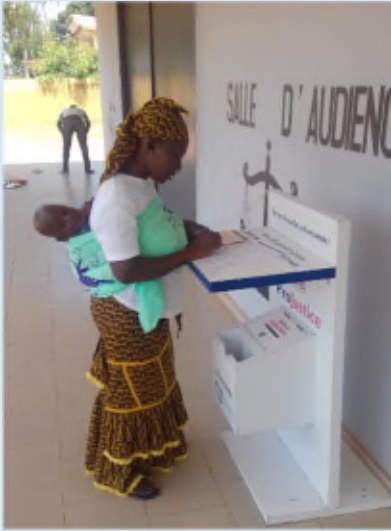
Un usuario de la corte llenando un cuestionario pre-impreso en una de las cortes piloto.