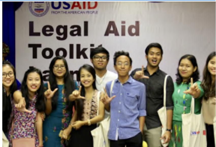
Abogados jóvenes, paralegales, y representantes de organizaciones de Sociedad civil en la ceremonia de lanzamiento del Juego de Herramientas de Ayuda Legal