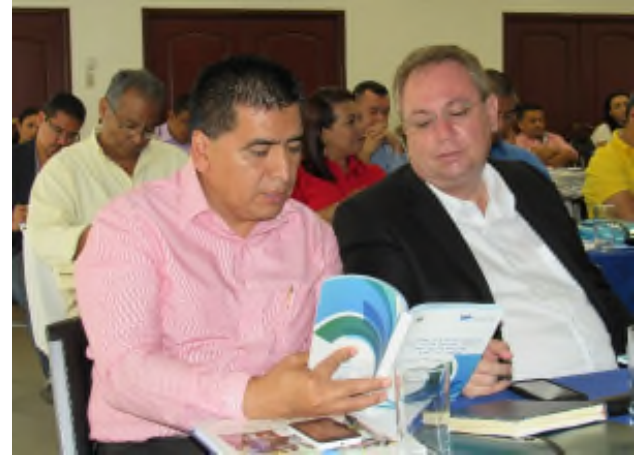
Representantes del Municipio de Cojutepeque participando en un evento de capacitación sobre acceso a la información patrocinado por el Proyecto.